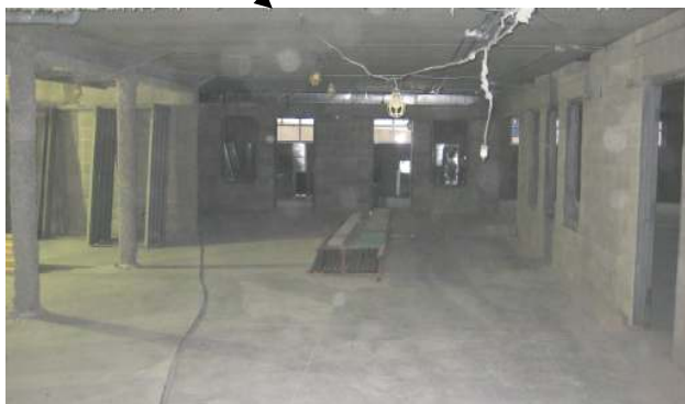
兒童事工地庫 （育嬰室、幼兒室、兒童崇拜室、少年崇拜室、兒童事工辦事處） 主要家具：教學用具、小朋友尺寸椅子、牆櫃等。