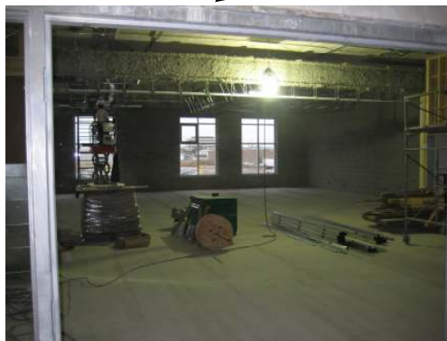
一樓 （崇拜禮堂、廚房及茶室 Cafeteria） 主要家具：崇拜座椅、廚具、小型餐桌及座椅等。