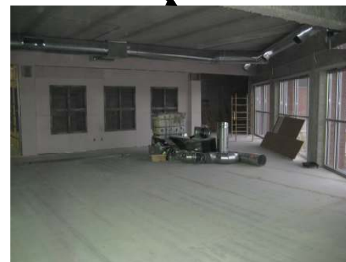
二樓 （崇拜禮堂、祈禱室、資源中心及圖書館辦事處） 主要家具：崇拜座椅、書架、電腦桌、圓桌、走廊座椅等。